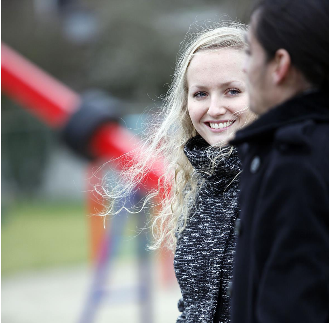
Fotografie Sacha Ruland, buddy en maatje